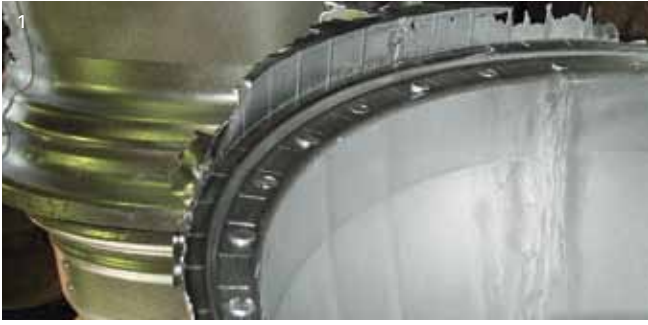
1 Unbearbeitete Räder 2 Bedienpult Y.MU231