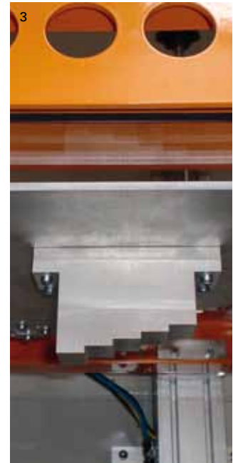
1 Kabine Y.MU231 2 Fertiges Rad 3 Kalibrier-Stufenkeil